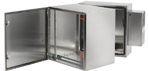
ProTek Puerta con doble bisagra