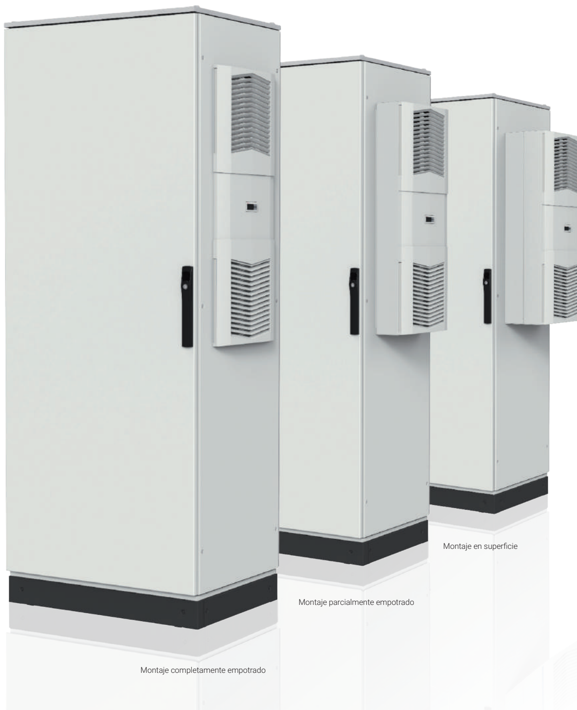
Montaje completamente empotrado